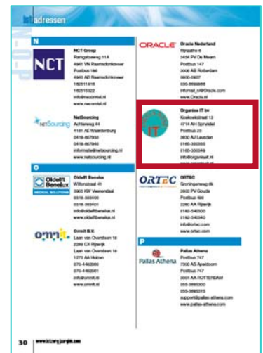
Print 'Bedrijven van A t/m Z'